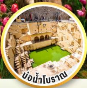
บ่อน้ำโบราณ