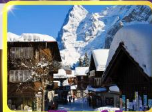
หมู่บ้านมูร์เรน