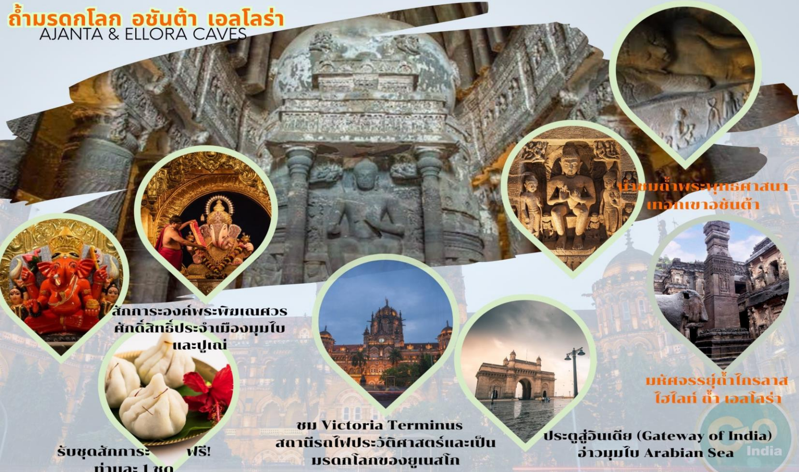
นั่งชมถ้ำพระพุทธรูปศาสนา เทวสถานอชันต้า