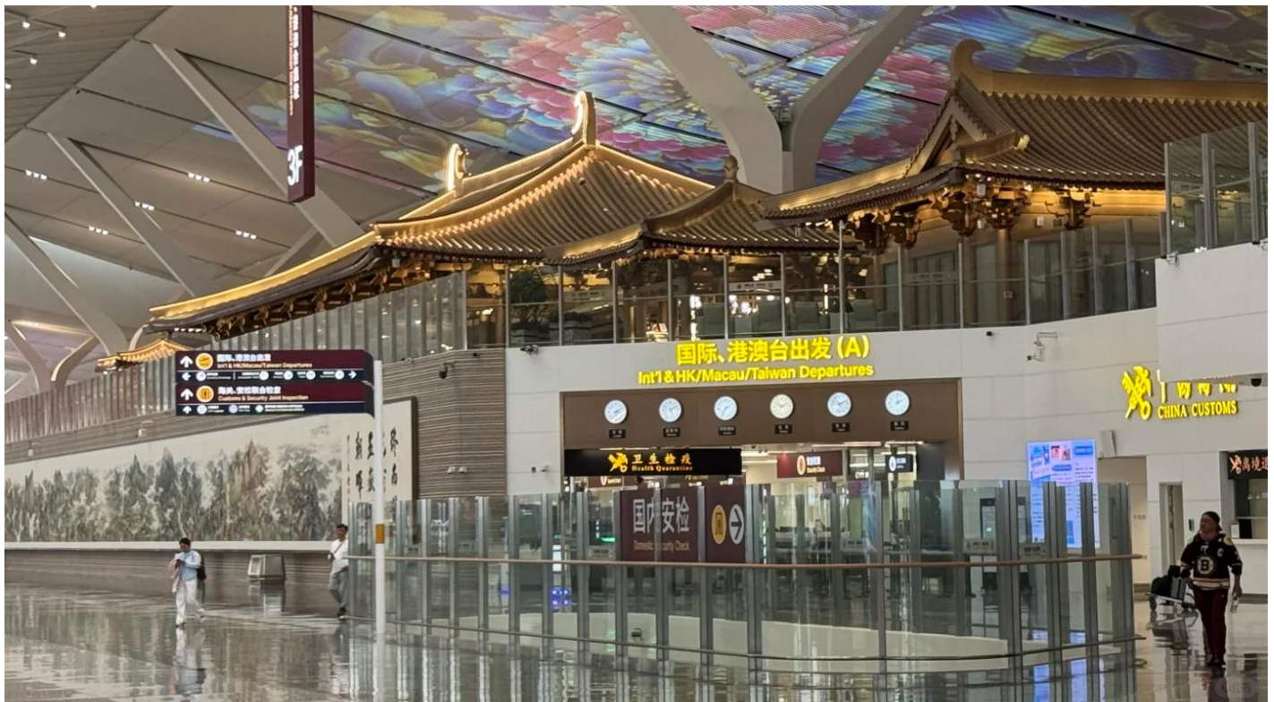
GO1XIY-SL006 บินตรงซีอาน ย้อนเวลาสู่อางอัน เจิ้งโจว ลั่วหยาง หยุนไถซาน 6 วัน 5 คืน โดยสายการบิน ไทย โลออนแอร์ (SL)