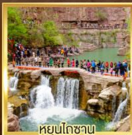
หยุ่นโกซาน