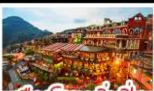
เมืองโบราณจิ่วเฟิ่น

ฟาร์มแกะซิงจิ้ง - ทะเลสาบสวี่นจินตรา จิ่วเฟิ่น - หมู่บ้านประมงหลากสี - ไทเป 101 หมู่บ้านสายรุ้ง - ตลาดล่าหูก & ซีเหมินตง ปลาประ-ธานธิบตี - เขียวหลงเปา