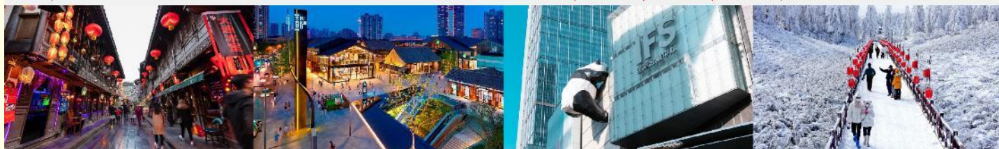
ถนนโบราณจิ้นหลี่