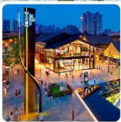
ถนนคนเดินไท่กู่หลี