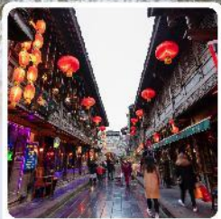
ถนนโบราณจีนหลี