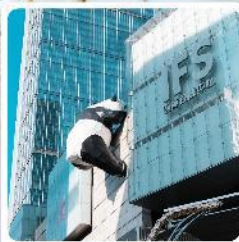
IFS ตึกหมีแพนด้า

● ไอโกล์ นั้งกระเช้าขึ้นชมภูเขาหิมะวาวู ซ็อบบั้งถนนชุนซีลู่ แลนด์มาร์คแพนด้ายักษ์เป็นตึก IFS เจิงตู