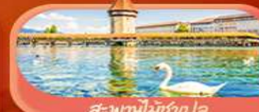
สะพานไมซ์าปก

Highlight เยือนหมู่บ้านแสนสวยเซอร์แมท เช็กอินศาลาไทยสุดงามที่โลซาน เที่ยวลูเซิร์น ชมสะพานไม้ชาเปลและอนุสาวรีย์สิงโต ซาลี แพลสซิ่ง ชมประติมากรรม The Fork และปราสาทซิลลองริมทะเลสาบ เยือนมิลาน มหาวิหารดูโอโม เที่ยวเวนิส เมืองลอยน้ำสุดโรแมนติก อินกับรักอมตะที่บ้านจูเลียต และช้อปปิ้งจุใจที่ Serravalle Outlet