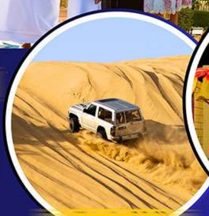
รถเช่าราย 4X4