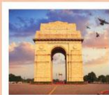
♥♦♦ India Gate