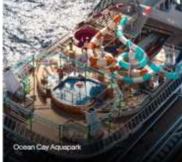
Ocean City Aquapark