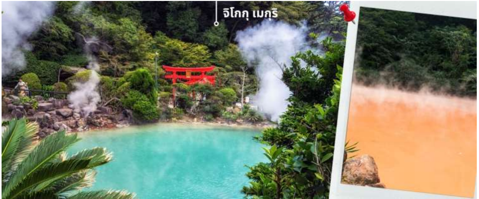
จิโงกุ เมกิริ