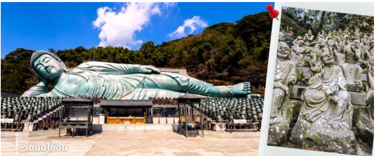
วัดนันโซอิน