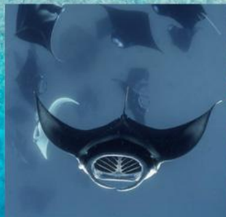
Manta Ray Snorkeling