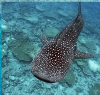
Whale Shark Snorkeling